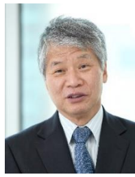
石田 東生 (いしだ はるお)

1989年京都大学大学院工学研究科博士後期課程単位取得退学。工学博士。1989年京都大学工学部助手、カリフォルニア大学客員研究員、ノルウェー国立都市地域研究所文部省在外研究員、岡山大学環境理工学部助教授、2002年同教授等を経て、2009年より現職。2015年より公益社団法人日本交通計画協会代表理事、2021年より社会資本整備審議会都市計画・歴史的風土分科会分科会長。コンパクトシティ研究で文部科学大臣賞(科学技術賞)(2021年)、都市計画学会石川賞(2022年)、ほか土木学会・不動産学会・都市計画学会等で論文賞受賞多数。『世界のコンパクトシティ』(編著、2019年、学芸出版社)のほか多数の著書を執筆。